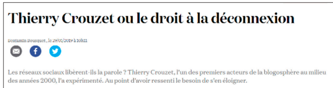
Illustration 2. « C'est en 1996 que j'ai publié mon premier billet »

Les médias sociaux pourront difficilement se substituer aux blogs : sur les médias sociaux, on parcourt les titres des articles, on ne les lit pas – ou on en lit peu.