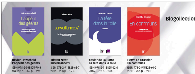
Illustration 5. Titres de la collection de blogs en livres

La pertinence de la diffusion sur le blog, au bon moment, constitue un poids mort dans le livre, qui devient un livre de souvenirs de moments opportuns.