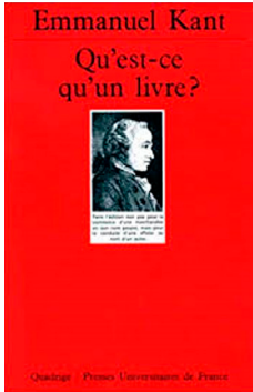
Illustration 4. « Un livre est l'instrument de la diffusion d'un discours au public »